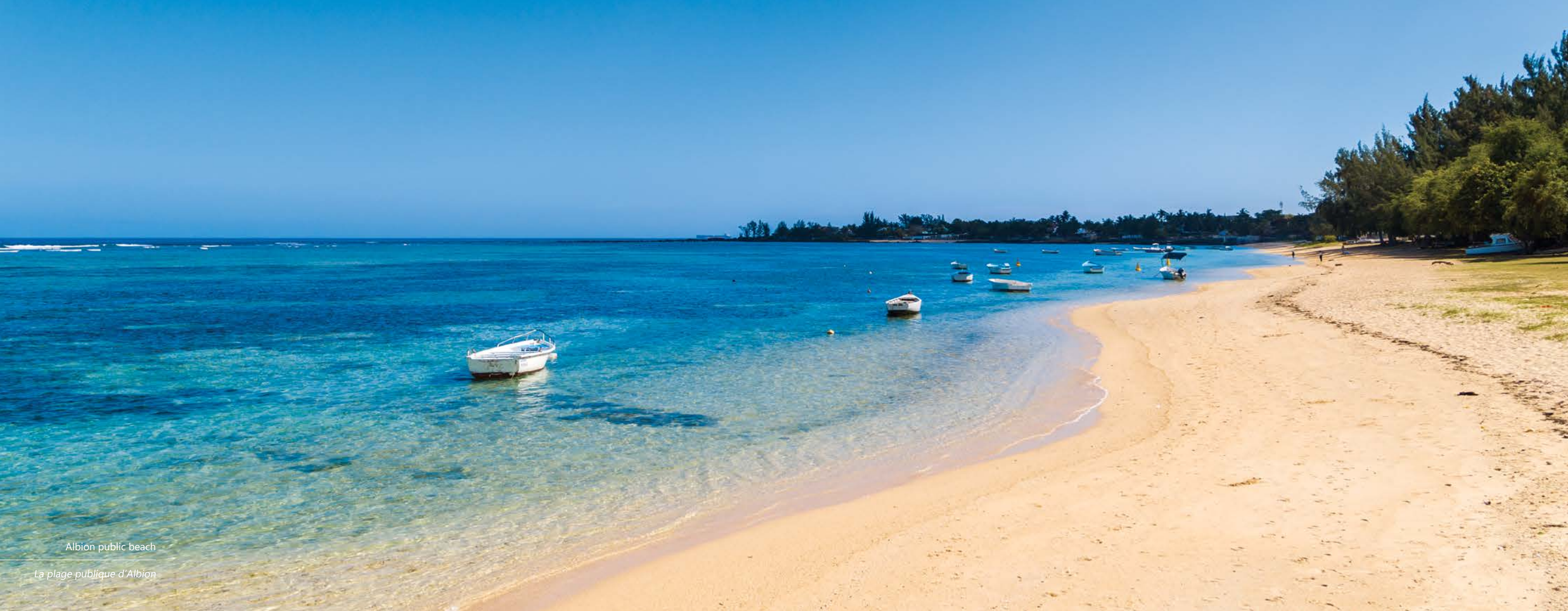
Albion public beach