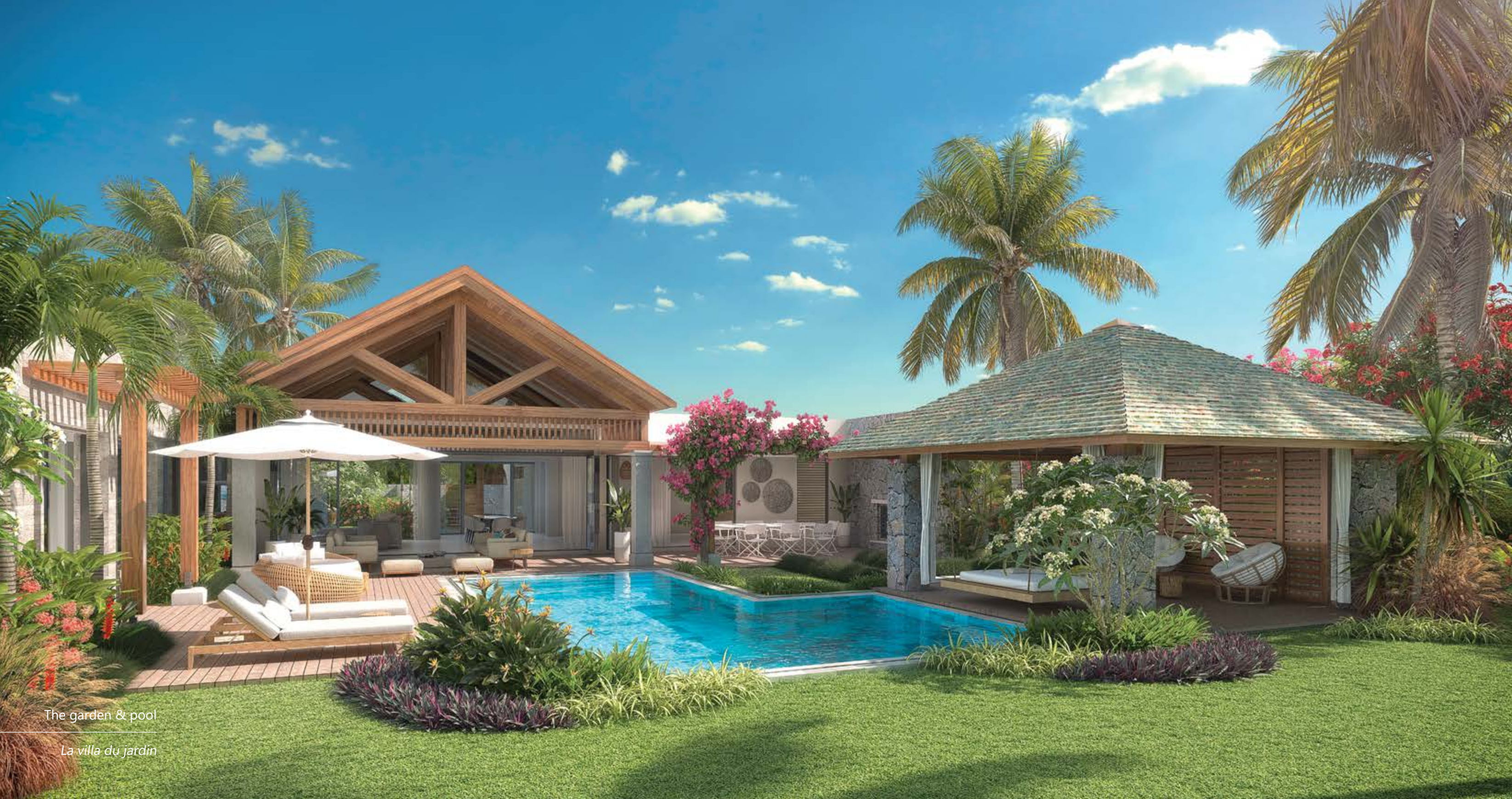
The garden & pool