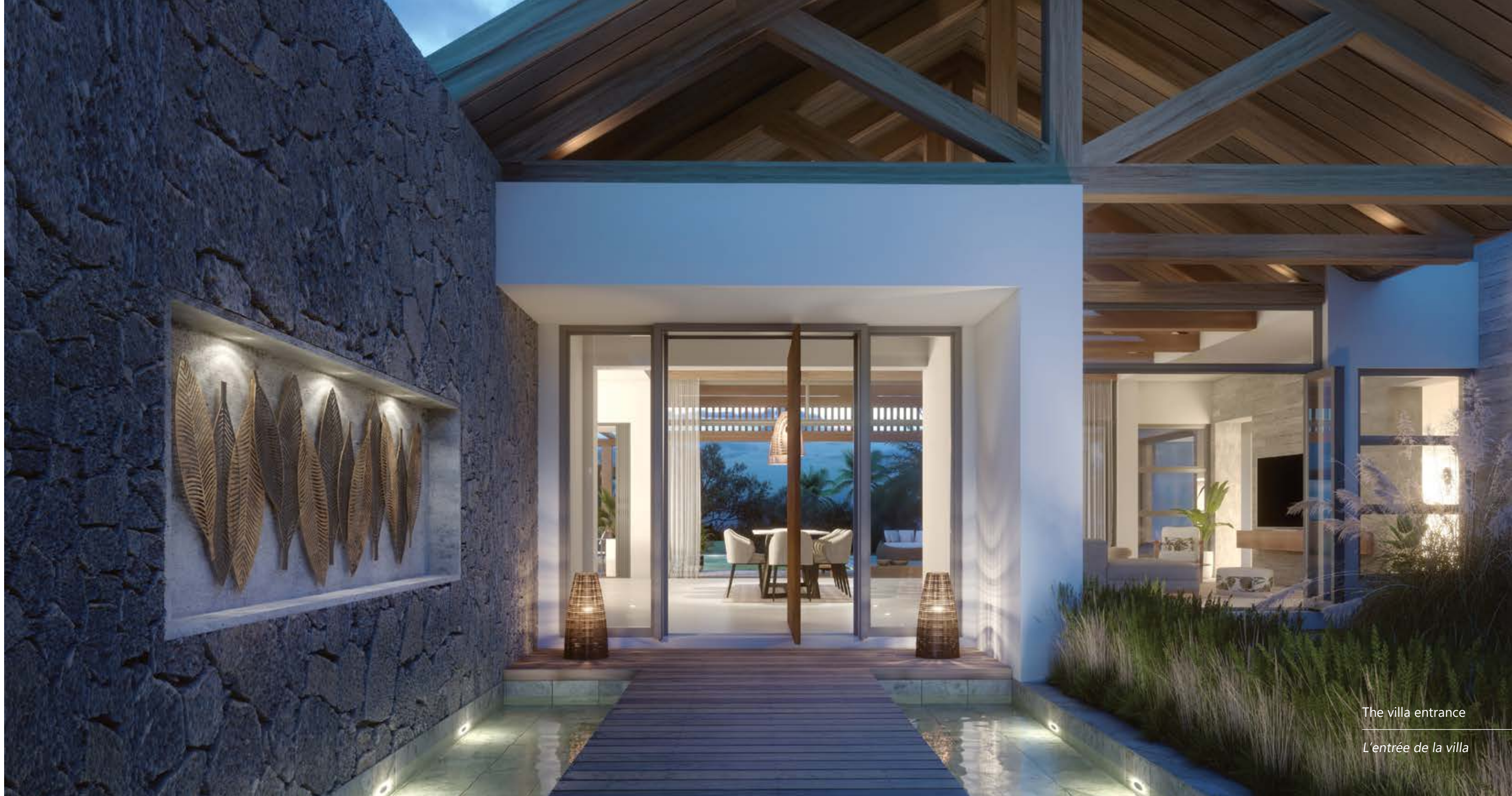
The villa entrance